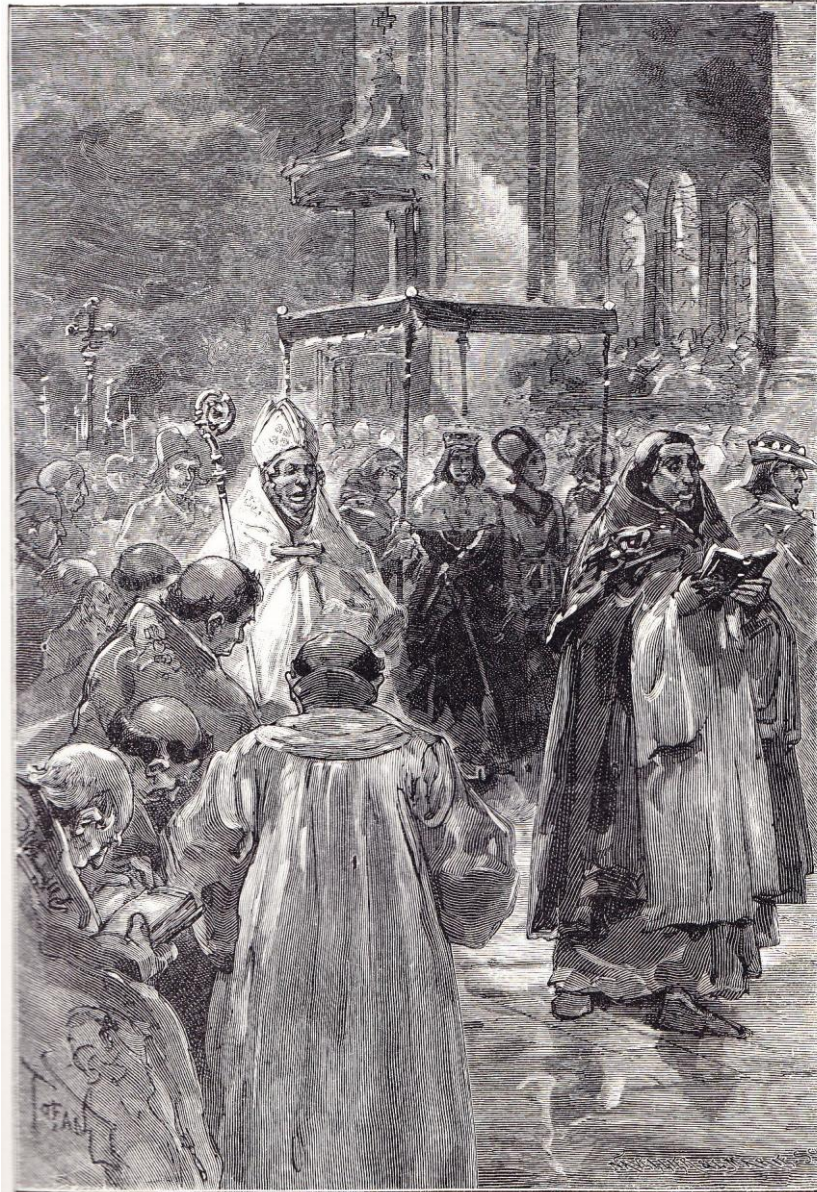
LE SACRE DE CHARLES V (CHAP. XV)